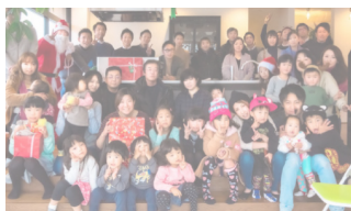
お客様と盛り上がる、大人気のクリスマスパーティー

当社の住宅ブランド「アーバンホーム」は資金計画はもとより、お客様の毎日がより充実するご提案を行います。さらにお客様との繋りを大切に、アフターフォローも万全。地域の幸せな暮らしを後押しします。