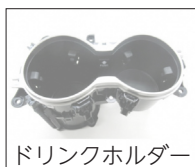
ドリンクホルダー