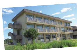
◀九州開発センターが入る旧二小北校舎