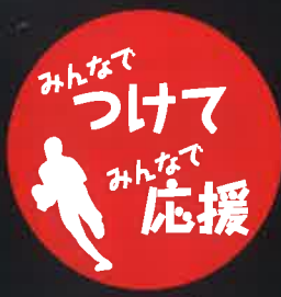
ロゴ付きナンバー