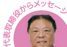
代表取締役からメッセージ