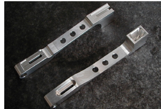
▲オリンピック選手に特注で製作したスピードスケート用部品