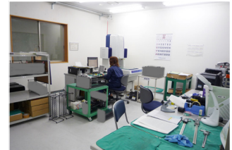
▲温度管理された室内で製品を検査します