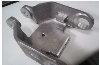
▲振動試験装置の部品となるマグネシウム加工製品