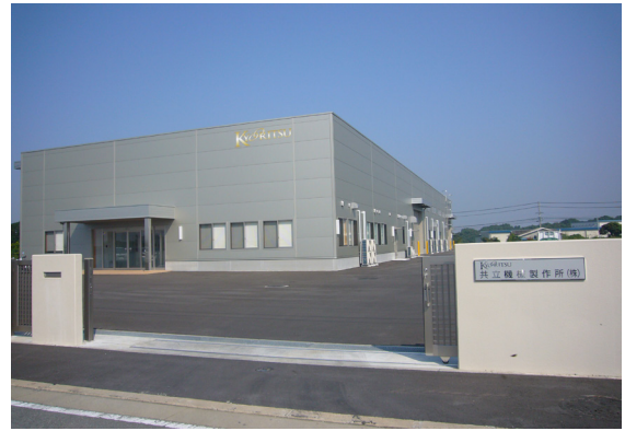
▲共立機械製作所株式会社 荒尾工場