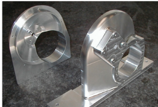
▲CAD データを元にした 3D 加工製品